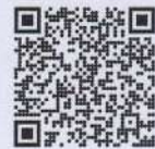
บัญชีรายชื่อหน่วย ตามรายการแจกจ่าย