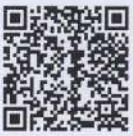
คู่มือแนะนำการสมัครใช้งานแอปพลิเคชัน, การถอนดอกเบี้ยประจำปี และการตรวจสอบสถานภาพเงิน อทบ. ด้วย แอปพลิเคชัน "OOMSUB"