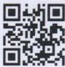
ดาวน์โหลดแอปพลิเคชัน "OOMSUB" ทั้งระบบ Android และ iOS

๒. สก.ทบ. ขอให้หน่วยประชาสัมพันธ์ ให้กำลังพลได้รับทราบข้อความในวิทยุราชการนี้ เพื่อสิทธิประโยชน์ของกำลังพล พร้อมทั้งศึกษา การดาวน์โหลด และใช้งานแอปพลิเคชัน OOMSUB จาก QR-Code ทำยวิทยุราชการฯ ฉบับนี้ ทั้งนี้ สามารถสอบถามรายละเอียดเพิ่มเติมได้ที่ ฝ่ายดำเนินการวิธีข้อมูล กอท.สก.ทบ. หมายเลขโทรศัพท์ ๐-๒๖๕๗-๓๗๑๒-๑๖ และ แผนกเงินฝาก กอท.สก.ทบ.หมายเลขโทรศัพท์ ๐-๒๖๕๗-๓๗๑๒-๘๕, ๙๐